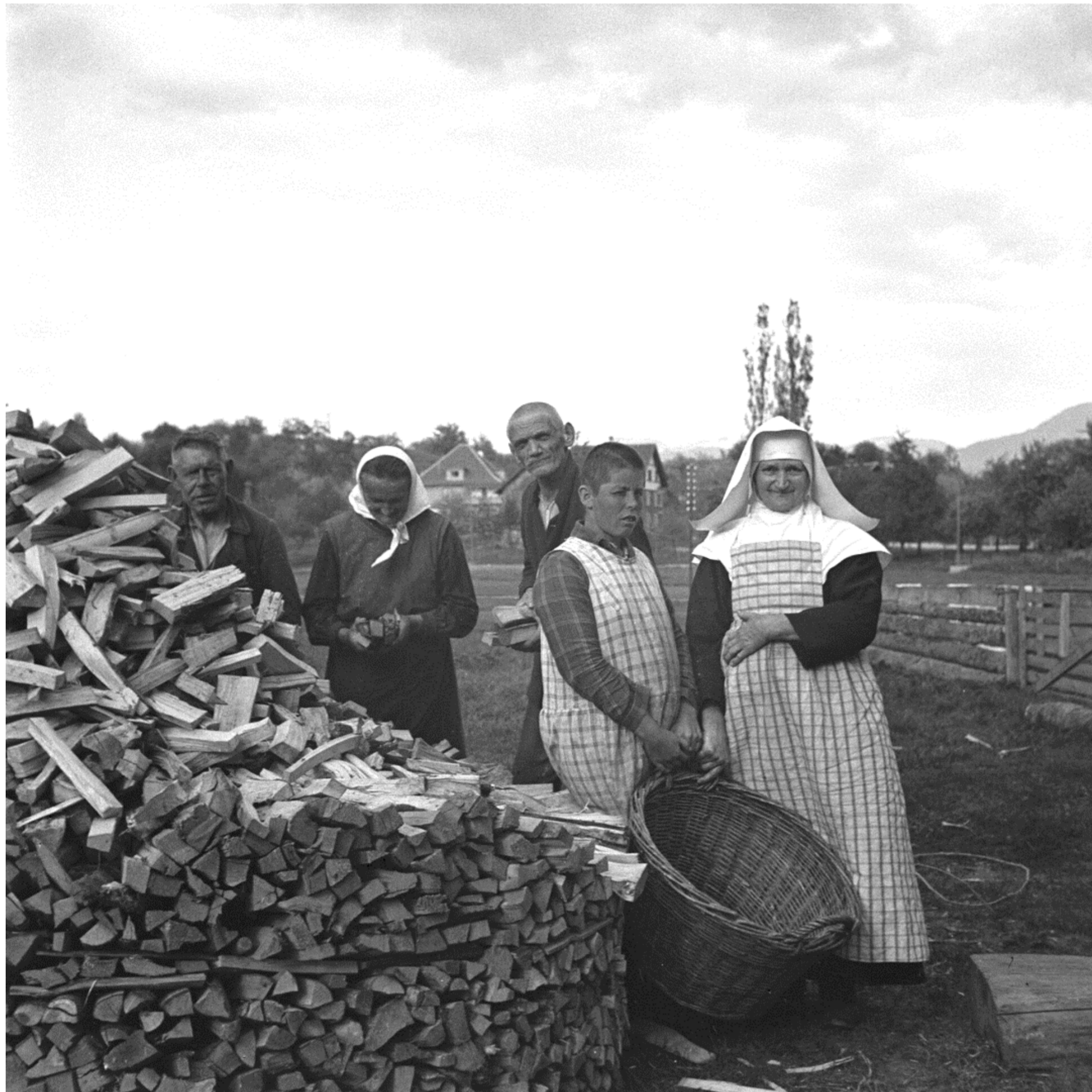
Bewohnerinnen und Bewohner des Armenhauses Mauren (Tschugmell-Fotoarchiv, Gemeindearchiv Mauren, Foto: Fridolin Tschugmell).