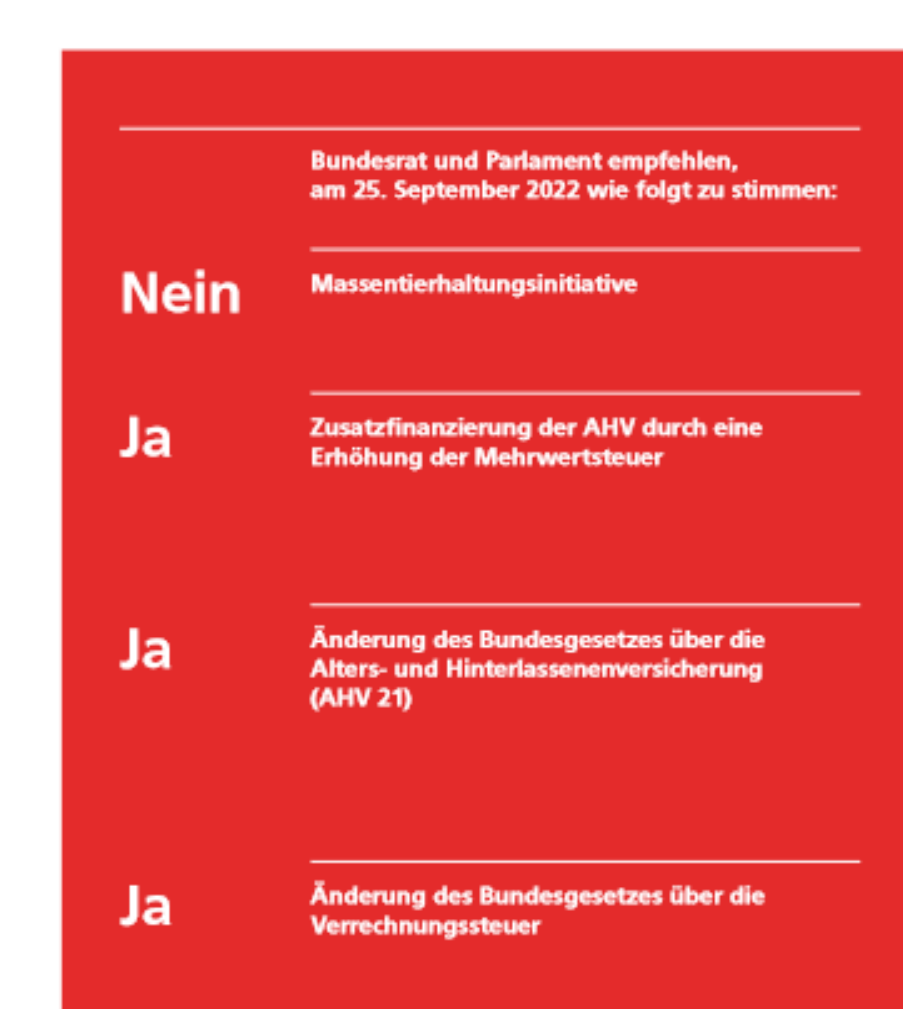
Abb. 3: Abstimmungsempfehlungen ...