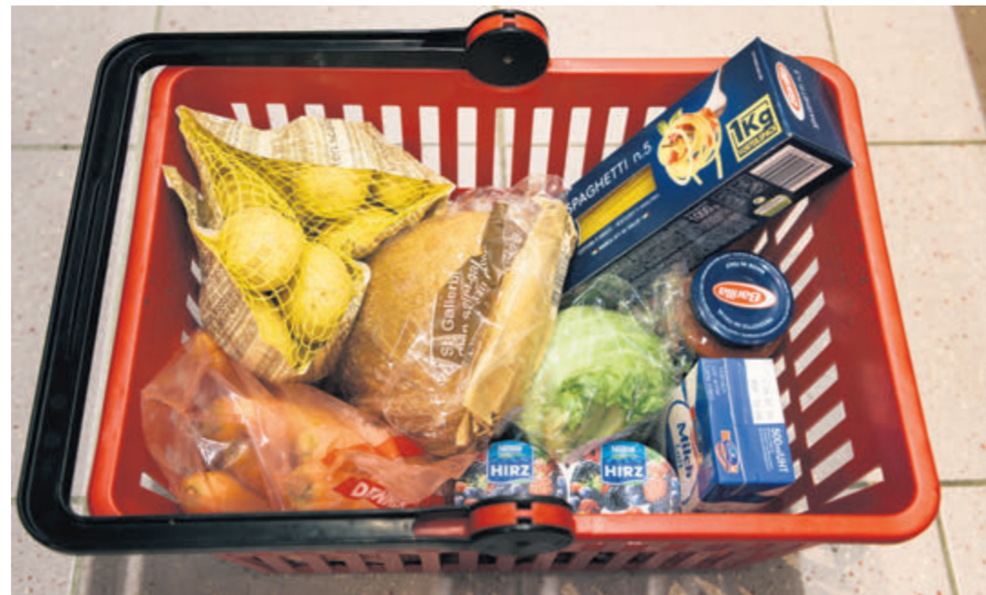
Um den Preisanstieg zu berechnen, wird ein Warenkorb von Konsumgütern verwendet.

Damit Geld seine Funktionen als Tauschmittel, Recheneinheit und Wertaufbewahrungsmittel erfüllen kann, braucht es Vertrauen in die Wertstabilität. Steigen die Preise, verliert Geld an Kaufkraft und man spricht von Inflation, im gegenteiligen Fall von Deflation. Sowohl eine hohe Inflation wie auch Deflation unterminieren das Vertrauen und haben volkswirtschaftlich schädliche Wirkungen. Deshalb ist das oberste Ziel der SNB die Preisstabilität, welche sie mit einer Inflationsrate von 0 bis +2% definiert. Änderungen des Preisniveaus in einer Volkswirtschaft werden anhand von Preisindizes gemessen. Ein prominentes Beispiel ist der Landesindex für Konsumentenpreise (LIK). Die Grafik zeigt die Inflationsrate des LIK bis in die 1960er-Jahre zurück. Aufgrund der engen Verflechtung Liechtensteins mit der Schweiz – Zoll- und Währungsunion, teilweise gemeinsame Steuern wie Mehrwertsteuer – ist der LIK auch für Liechtenstein relevant und wird auch regelmässig vom Amt für Statistik publiziert, weil kein liechtensteinischer Preisindex existiert. Das Preisniveau hängt von verschiedenen Faktoren ab. In erster Linie von der Nachfrage, welche